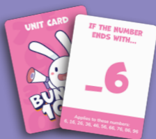
ユニットカード 10枚