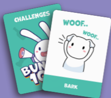
45枚のチャレン ジカード